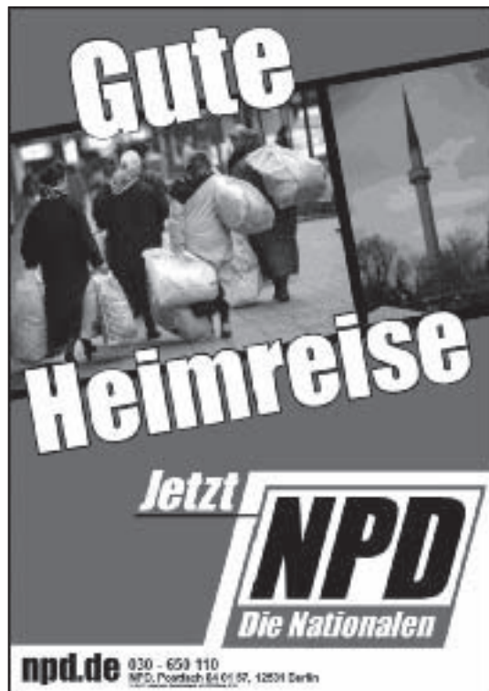
Abb. 14: NPD-Plakat „Gute Heimreise“