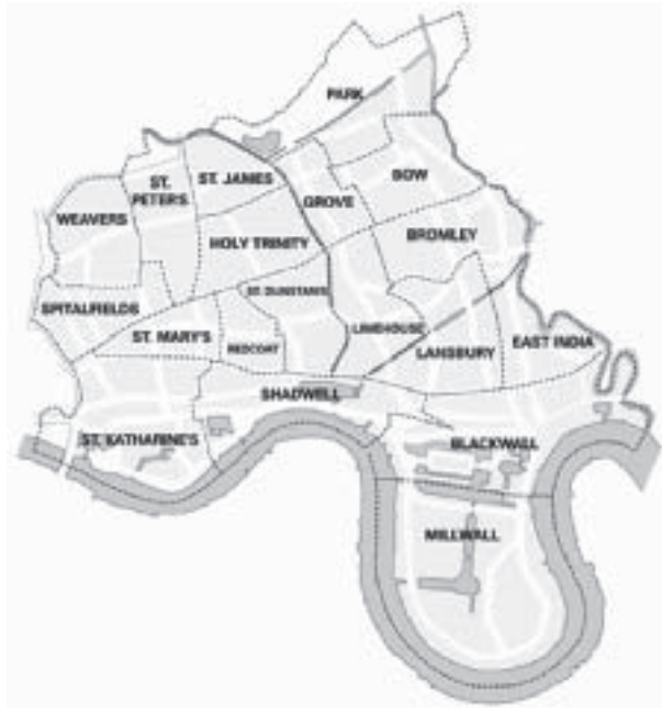
Abb. 8: Karte des Londoner Stadtteils Tower Hamlets