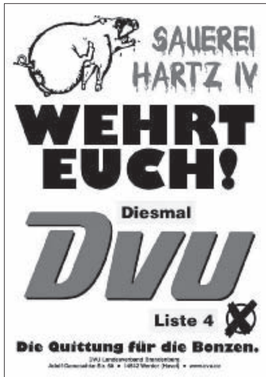
Abb. 5: DVU-Plakat „Sauerei Hartz IV“