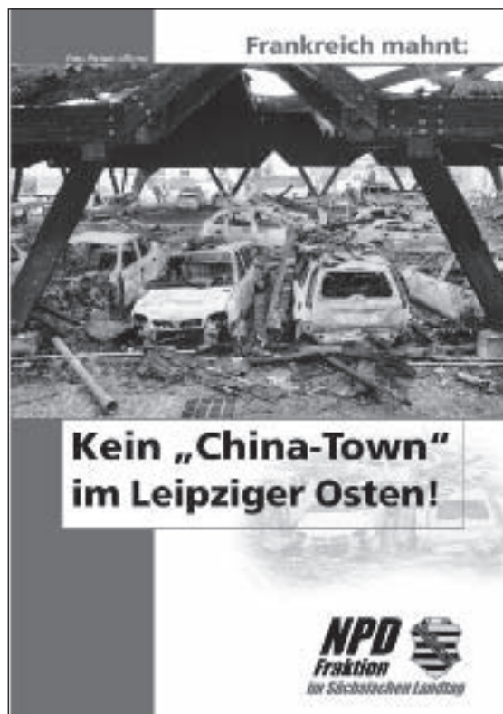
Abb. 6: NPD-Infoblatt „Chinatown Leipzig“

Ganz gezielt sollen Krisenherde geschaffen werden, um im Sinne der Globalisten Völker aufeinander zu hetzen. 121 „Globalisten“ gelten als verschworene Gruppe übermächtiger Globalisierungsbefürworter, die angeblich eine planvoll gesteuerte Vernichtung von Kulturen, Traditionen und Werten anstreben (vgl. hierzu genauer das Kapitel IV).