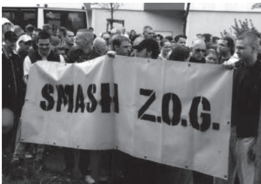
Abb. 11 Transparent bei einer rechtsextremen Demonstration

Rechtsextremisten sehen also den Prozess der Globalisierung als willentlich gesteuerte Vernichtung von Kulturen, Traditionen und Werten (und letztlich von Nationen und Völkern) durch die oben beschriebenen mächtigen „Globalisten“. Im von Rechtsextremisten international verstandenen Code sind „Globalisten“ auch „Ostküste“ ist der „Globalismus“ auch „New World Order“ (NWO) und sind die in diesen „Globalisierungsplan“ verwickelten Regierungen und Eliten auch „Zionist Occupied Government“ (ZOG).