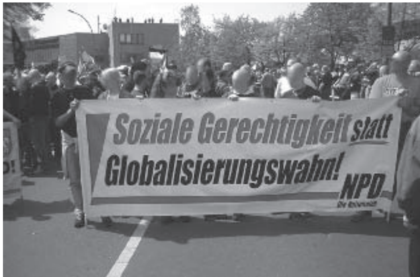
Abb. 12: Transparent bei einer Demonstration der NPD

Genau im Sinne des hier zitierten Beispiels wird im Parteiorgan „Deutsche Stimme“ seit geraumer Zeit in zahllosen Artikeln vorgegangen. Des weiteren stehen eine Reihe von Demonstrationen unter Bannern wie „Gegen Krieg und US-Globalisierung – Volksgemeinschaft statt Globalisierungswahn“. 166