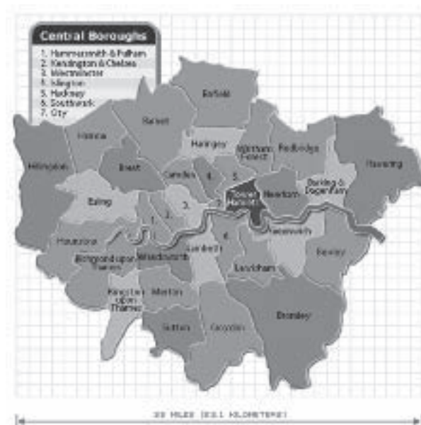
Abb. 7: Karte der Londoner Bezirke

Kandidaten 7,0 Prozent (absolut: 4.140 Stimmen) bei einer überdurchschnittlich hohen Wahlbeteiligung von 53,6 Prozent und wurde damit zur drittstärksten Partei nach Labour und den Liberaldemokraten, die mit 50 bzw. 47 Kandidaten angetreten waren. In den vier Wahlbezirken (Millwall, Holy Trinity, St. James' und St. Peter's), in denen die BNP angetreten waren, erreichten ihre Kandidaten zwischen 20 und 27 Prozent. 127 Wie und unter welchen Kontextbedingungen war ein solcher (lokaler) Erfolg möglich?